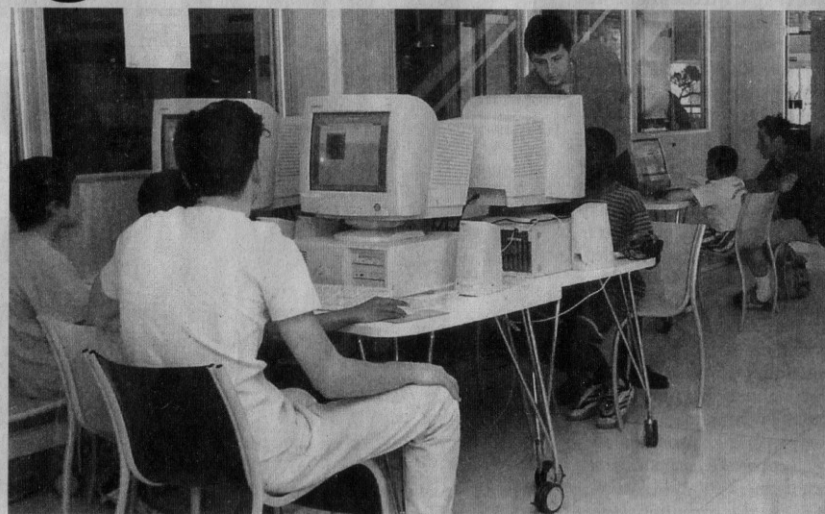
La centrale géothermique se trouve avenue de Cornebarrieu L'espace culture média d'Odyssud met l'informatique à la portée de tous: utilisation des machines, formations, informations et débats

Dans le cadre de rencontres thématiques, l'atelier multimédia d'Odyssud organise ce samedi 18 février de 15 heures à 17 heures une information sur les logiciels libres assurée par l'association « Toulibre », un groupe toulousain d'utilisateurs. Lors de ce forum (FAQ pour les initiés), l'association présentera d'une façon accessible à tous, l'histoire du mouvement des logiciels libres, ses aspects éthiques et philosophiques, son mode de développement, ses intérêts. Le public découvrira « une vision citoyenne de l'outil informatique par le partage du savoir et des connaissances » indique Thomas Petazzoni de l'association « Toulibre ». Tous les utilisateurs d'ordinateurs devraient y trouver leur compte. En effet, comme son nom l'indique, le logiciel libre est librement utilisable et copiable, modifiable et diffusable. Dans la deuxième partie du forum, de courtes démonstrations de certains des principaux logiciels libres seront proposées. Entre autres, le système GNU/Linux, la suite bureautique Open Office.Org, le navigateur Web Mozilla Firefox, Le logiciel de dessin et de retouche photo «